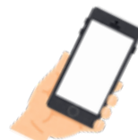
マイナンバーカード読み取り対応のスマートフォン